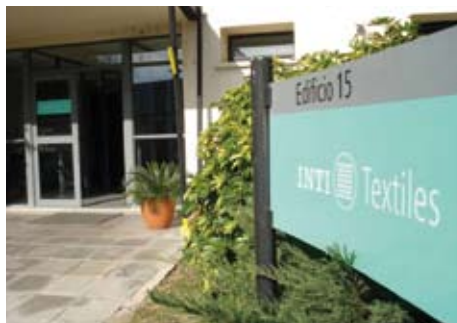
En el Centro INTI | Textiles funciona el Observatorio de Tendencias

.. «Una idea fija, siempre parece una gran idea, no porque sea grande sino porque ocupa todo nuestro cerebro». (Jacinto Benavente)