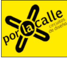
Circuitos por la Calle