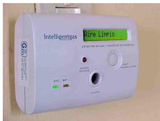
Fig. 2: Foto del producto terminado