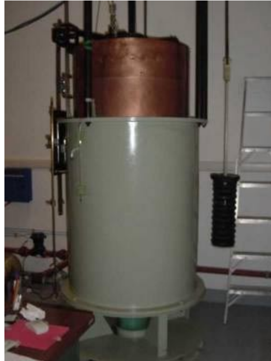
Campana de medición de 0,5 m 3 de volumen nominal