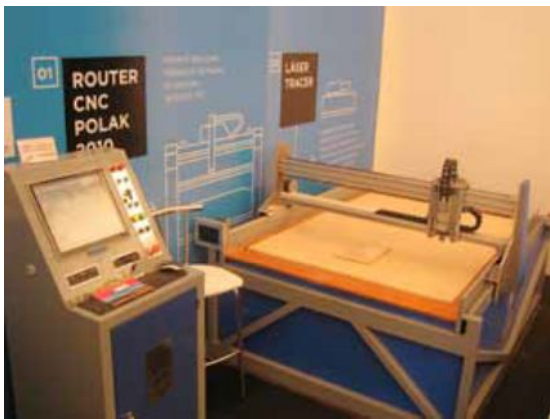
Figura 1. Router Polak 2010 presentado en Tecnópolis.

Continuando con el desarrollo del router de control numérico "Polak 2010" (comenzado en INTI en el año 2010) y con el objeto de mejorar las capacidades de diseño mecatrónico del sector, se diseñó una mesa RR que permitirá ampliar las prestaciones del equipo actual para poder gobernar 5 ejes simultáneos (RRLLL).