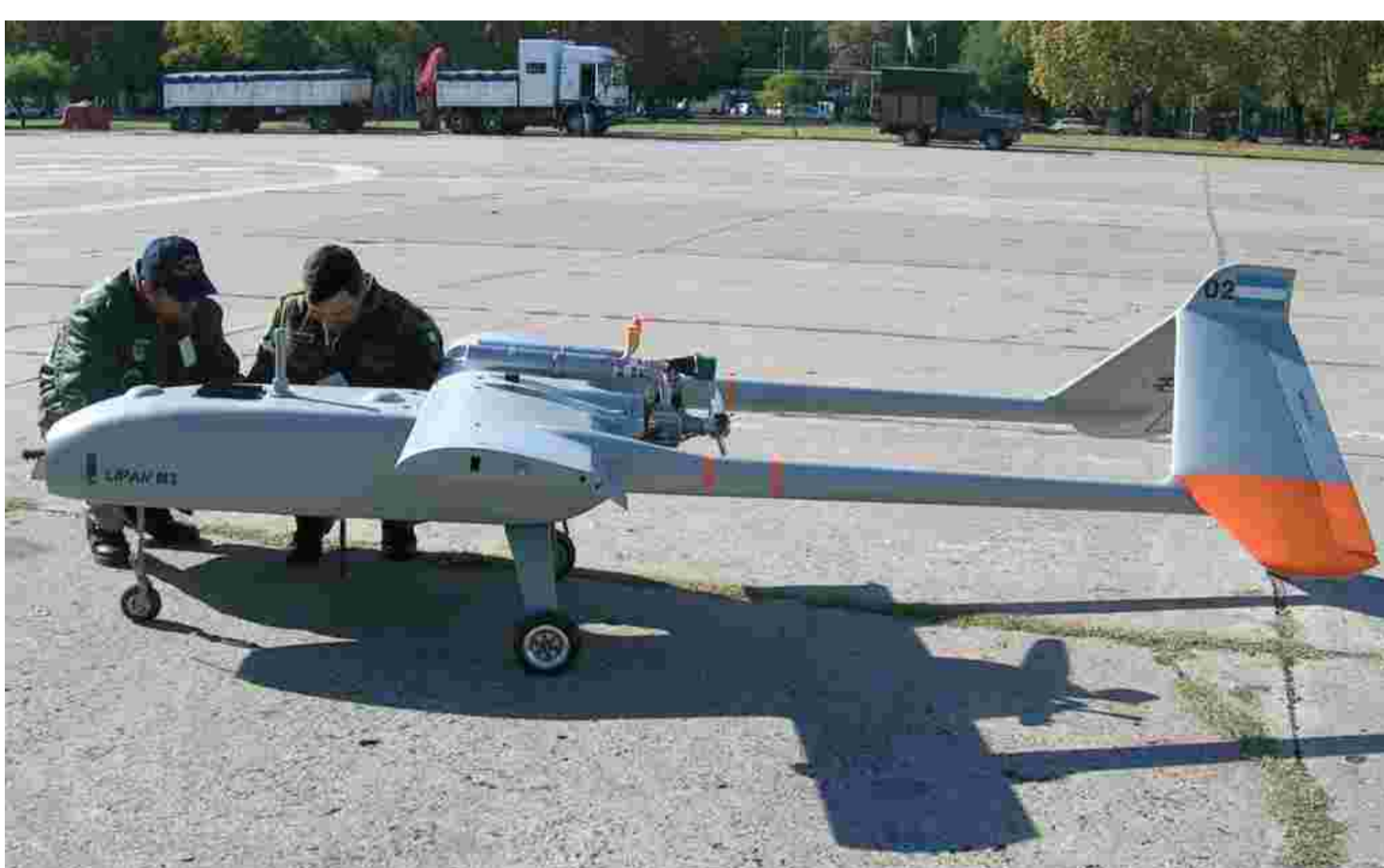
Vehículo aéreo no tripulado LIPAN.