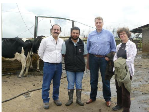
Figura 3: Visita a tambos durante la primera misión de INTI-Lácteos en el marco del proyecto.