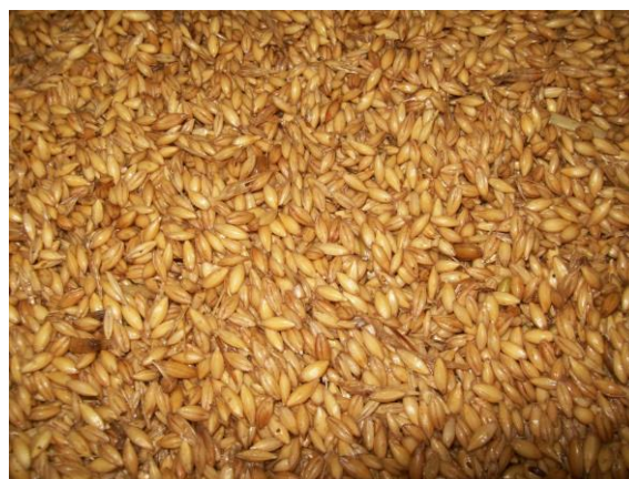
Figura 1: Prueba de malteado de cebada

En cuanto al punto C, en el Centro de Cereales y Oleaginosas se desarrolló, diseño y construyó una maltería piloto de 10 kg. de cebada por batch. En esta planta se están realizando ensayos con el objeto de iniciar con el desarrollo de maltas bases y especiales. Esta planta, una vez puesta a punto, estará disponible como herramienta para realizar tareas de investigación tanto del comportamiento maltero de diferentes cebadas y otros granos, como para el desarrollo de nuevos productos y la evaluación de diferentes parámetros de producción. (Ver figura 1 y 2)