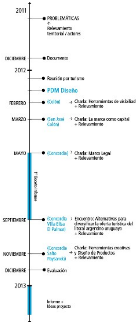
Figura 3: Línea de tiempo del proyecto.

Durante el año 2012 en el marco del proyecto formulado por INTI-Diseño Industrial se realizaron cuatro misiones territoriales, que incluyeron el dictado de cuatro charlas, de las cuales participaron 110 personas de diversos sectores productivos (tanto del ámbito público como privado).