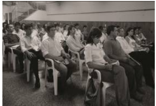
Figura 4: Fotos de las charlas.

Durante el 2013 se trabajará implementando en la región algunas de las ideas que surgieron en el proyecto.