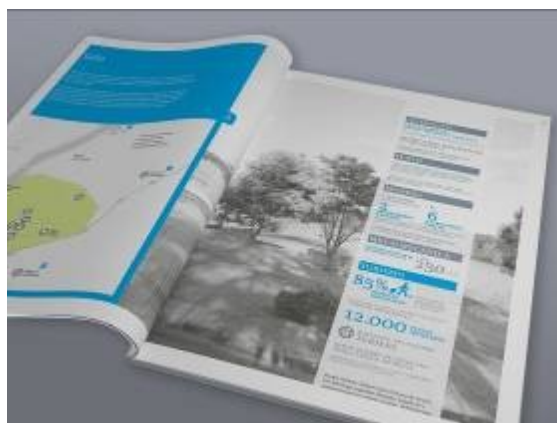
Figura 1 y 2: Documento de INTI–Diseño Industrial que reúne la información relevada y las oportunidades detectadas en el litoral argentino-uruguayo.

En este contexto se organizaron junto a INTI-Concepción del Uruguay y LATU una serie de charlas que permitieron tomar contacto con emprendedores de la región, vinculados al turismo. Se abordaron las temáticas de gestión de marca, propiedad industrial, desarrollo de productos y herramientas creativas, con una mirada integradora y participativa con los actores locales utilizando un modelo de acercamiento que permitirá redefinir y aplicar técnicas y herramientas en otros proyectos.