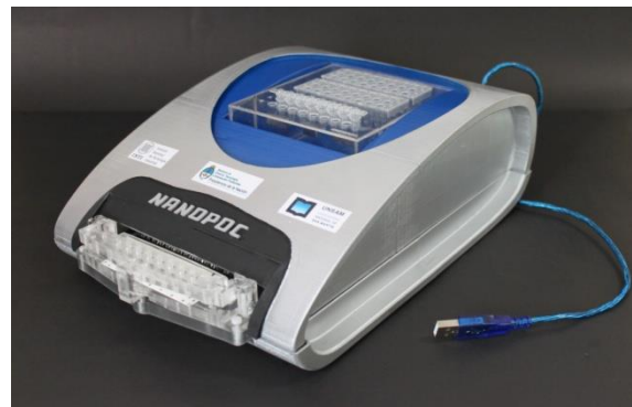
Figura 1. Primer Prototipo: Nanopoc

El primer prototipo se realizó bajo el concepto principal de que sea un producto portante y soporte, tanto de la electrónica como de la gradilla de procesamiento de las muestras [Figura 1].