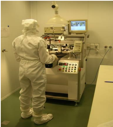
Figura 2. Serigrafiado. Sala Limpia.

En particular, el desarrollo del sensor demandó características intrínsecas de los métodos de diagnóstico actuales, entre los que se destacó que los mismos debían ser descartables por procedimientos de bioseguridad. Cada cartucho para detección se conforma de 8 sensores. El diseño de los cartuchos se realizó mediante un programa CAD y luego fue procesado en la fresadora CNC instalada en el Laboratorio de Prototipado. A su vez, cada sensor está compuesto de tres electrodos, serigrafiados con distintas tintas conductoras, por medio de la impresora serigráfica EKRA instalada en el Laboratorio de Película Gruesa dentro de la Sala Limpia [Figura 2].