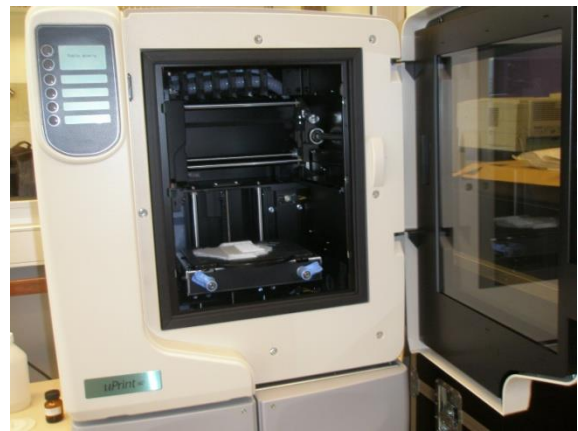
Figura 4. Equipo de Prototipado 3D Marca: Dimension Modelo: uPrint.

Para facilitar la manipulación de las muestras biológicas, aportadas por IIB-UNSAM, dispensadas con una propipeta multicanal, se diseñó en forma conjunta la celda de medición, la base soporte del sistema de alineación y los sostenes de la placa de conexión. Esto fue desarrollado como módulo, en la impresora 3D Dimension [Figura 4], a sólo efecto de realizar cambios rápidamente en fases de desarrollo, buscando que el mismo sea parte de la carcasa inferior en la producción, reduciendo así, la cantidad de piezas y complejidad del ensamblado a su mínima expresión.