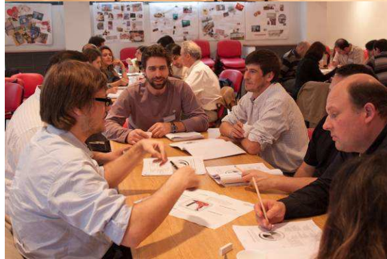
Figura 4 y 5: Programa de Formación dictado en La Pampa