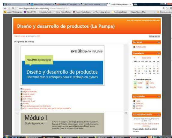
Figura 3: Plataforma de intercambio de información (campus virtual).

Los contenidos se estructuran en cuatro módulos que abordan por medio de la modalidad de taller aportes teórico-prácticos, nuevas herramientas y conocimientos para el desarrollo de productos en las pymes. Está dirigida a los activamente involucrados en el diseño y desarrollo de productos.