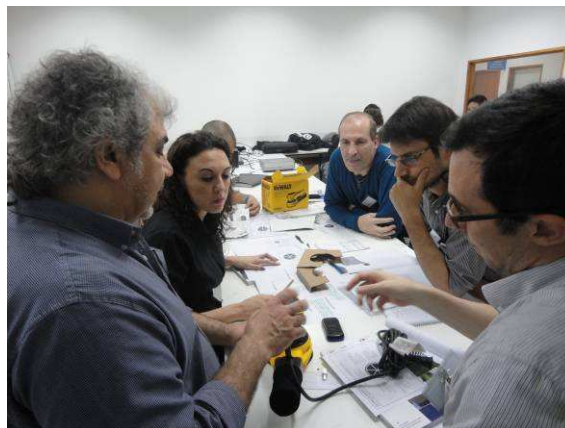
Figura 6 : Programa de Formación dictado en UTN.