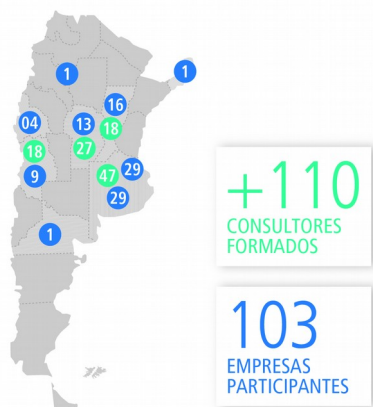
Figura 4: Distribución geográfica de empresas participantes y consultores formados.

-Más de 103 empresas participan del programa en 8 provincias y CABA, lo que les permite acceder al diagnóstico de manera gratuita. Estas empresas están trabajando en conjunto con los consultores, con el fin de obtener recomendaciones que les permitan proyectar acciones futuras relacionadas al diseño y desarrollo de sus productos.