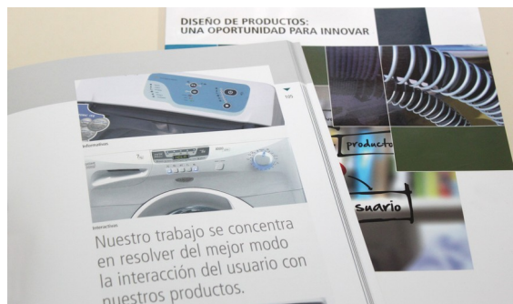
Figura 2: En el marco de este proyecto se realizó un manual para empresas titulado “Diseño de Productos: una oportunidad para innovar” y la “Guía Metodológica: diagnóstico de diseño para el desarrollo de productos”

Estos eventos permitieron tomar contacto con empresas de cada una de las regiones interesadas en acceder al asesoramiento gratuito en diseño. Estas actividades contaron con el apoyo de agremiaciones empresariales y cámaras sectoriales, áreas de gobierno, universidades y centros INTI de cada una de las provincias.