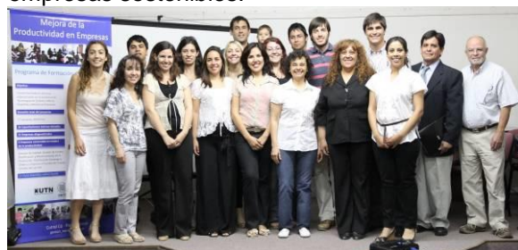
Figura 6: Equipo de Facilitadores y Tutores de INTI

El desarrollo del proyecto se llevó a cabo según lo planificado, alcanzando los objetivos propuestos. Asimismo, este proyecto tiene continuidad en la conformación de un equipo de facilitadores en mejora de la productividad que integrará la Unidad de Vinculación Tecnológica de la sede de la UTN en Plaza Huincul y contará con el acompañamiento del INTI. Se espera de esta manera mejorar el fortalecimiento del entramado productivo del interior de la provincia de Neuquén, ampliando la asistencia en tecnologías de gestión, promoviendo la mejora productiva y buscando empresas sostenibles.