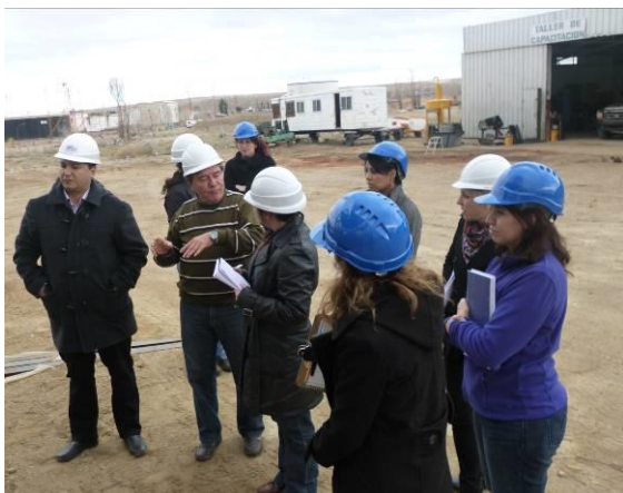
Figura 3: etapa práctica - trabajo en empresas

Complementariamente, se realizaron trabajos en gabinete en los que se procesaba la información de las visitas, se planificaban las próximas reuniones y la continuidad de la asistencia técnica.