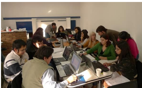
Figura 4: trabajo en gabinete

Con el objetivo de enriquecer el proceso de formación se realizaron periódicamente en el aula presentaciones de avances a cargo de los facilitadores, estudios de casos y análisis de las estrategias de intervención en las empresas.