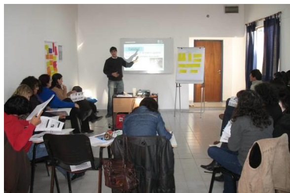
Figura 2: dictado de clases

La segunda etapa constó de una formación práctica de 4 meses de duración llevada a cabo en empresas manufactureras y de servicios de la zona. Se inició con un diagnóstico productivo a 13 empresas, en el que se relevaron diferentes aspectos productivos y de gestión y se propusieron posibles herramientas de implementación y mejora.