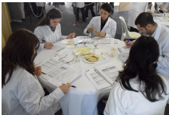
Figura 2: Entrenamiento de un grupo de jueces en el marco de la Expo Láctea del Norte 2012.