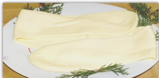
Figura 1: Queso de pasta hilada del noroeste argentino.

El Quesillo es un queso tradicional fresco de pasta hilada producido en el noroeste de Argentina, principalmente en la provincia de Tucumán. Se elabora en fábricas artesanales a partir de recetas tradicionales (Figura 1).