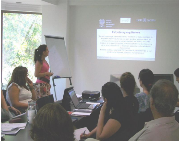
Figura 2: 2° Taller realizado en La ACSJ- San Juan, profesionales de los Laboratorios de La Red.

Profesionales de INTI-Lácteos, expertos en el área de aseguramiento de la calidad y con amplia experiencia de trabajo en redes de laboratorios, para la constitución de la “Red de Laboratorios de la Provincia de San Juan” fueron responsables de: