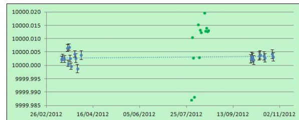
Figura 2. Valores individuales de resistencia obtenidos en el INTI (en azul) e INIMET (en verde) para las mediciones en 10 kΩ. La línea punteada indica la aproximación lineal por cuadrados mínimos de las mediciones del INTI.

donde u_c es la incertidumbre estándar combinada asociada con la diferencia medida. Se calculó como la raíz cuadrada de la suma de los cuadrados de la incertidumbre estándar combinada del INTI y la incertidumbre estándar combinada del INIMET. La componente de incertidumbre debida a la inestabilidad del patrón viajero resultó despreciable. En la Figura 2 se muestran los valores individuales medidos