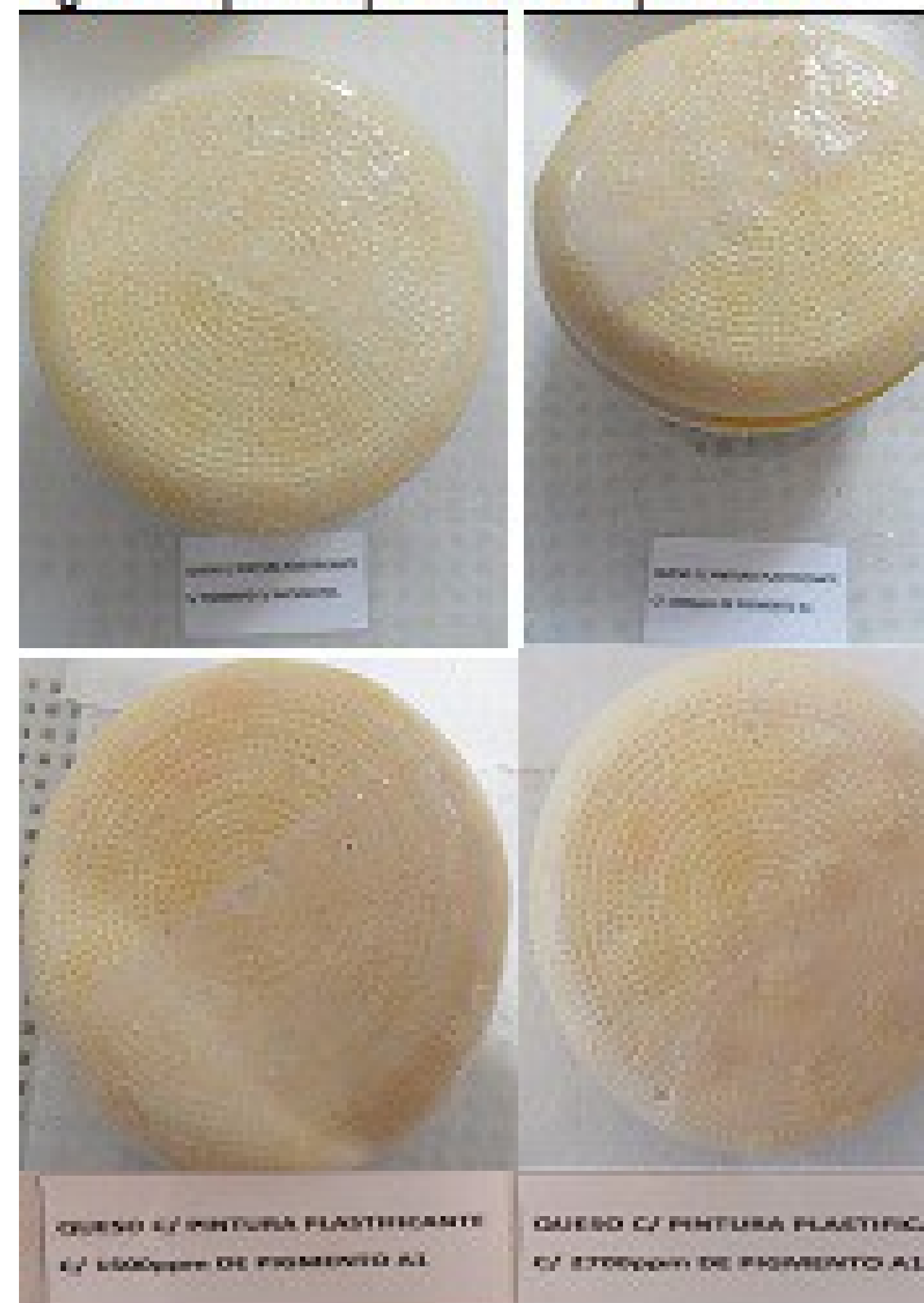
Figura 1: quesos pintados tiempo inicial 0.