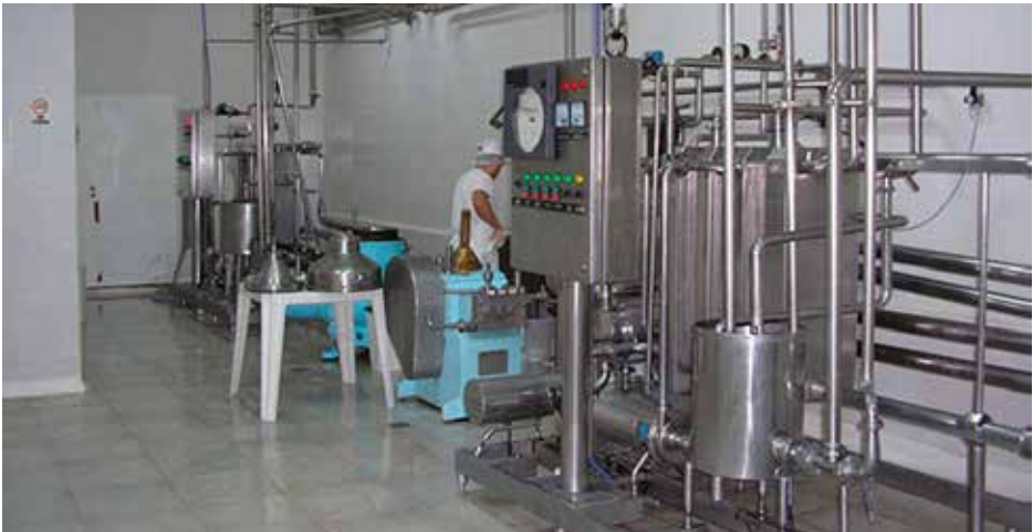
Equipo de Pasteurización.

63/65°C durante 30 minutos o de 65/68°C durante 10 minutos y luego se enfría a 32/36°C. Por lo general, esta pasteurización se realiza en la misma paila de elaboración.