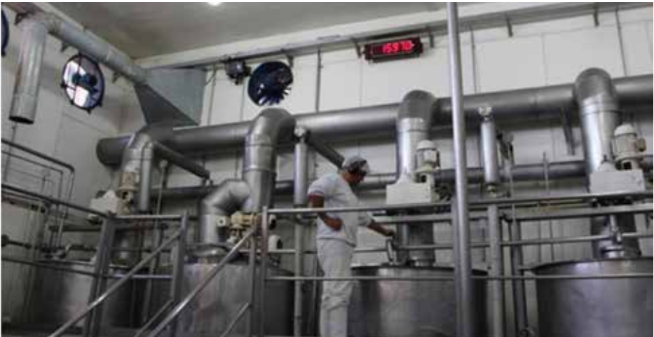
Sector de encajonado y empaquetado.

El empaquetado puede realizarse de diferentes maneras, en función del peso y tipo de envases.