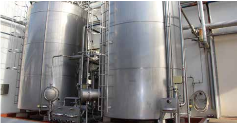
Tanques de almacenamiento de leche cruda.

El operario recolecta una muestra de leche a la que se le realizarán los siguientes análisis de laboratorio: antibióticos, acidez, composición, pruebas sensoriales (aroma, color, entre otras). Para ello, dependiendo de las características del camión cisterna, el operario se sube al vehículo para alcanzar las bocas superiores o escotillas y en otros casos, la toma se realiza desde el grifo (válvula). Los resultados de estos controles permiten decidir si se realiza la descarga de la materia prima en tanques/silos de almacenamiento.