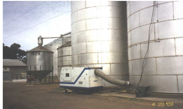
Fig. 2: Vista del equipo de refrigeración en funcionamiento en una planta de acopio.

Como continuación del proyecto, en la actualidad se están llevando a cabo las siguientes acciones, en conjunto con el CIPURE: