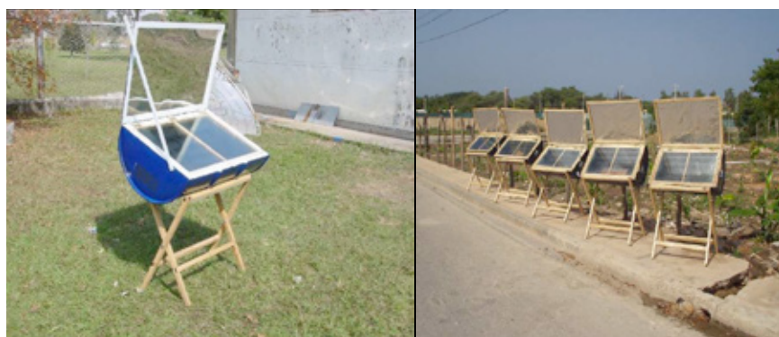
Figura 2: Distintas fotografías de la Cocitamb.

El MinDes brindó el apoyo informativo, administrativo, presupuestario y logístico necesario para apoyar la elaboración