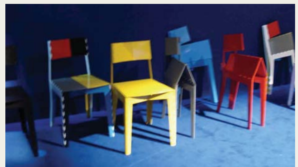
D. Sillas plegables de chapa de colores variados