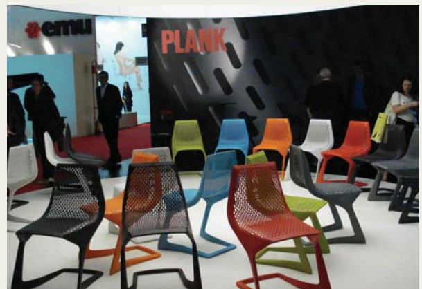
MYTO: Banqueta diseñada por Konstantin Grcic, presentada en Octubre de 2007 en el INTI, en la charla «Observar para entender»

El uso del color con tonalidades poco usuales tiñen las superficies de todos los materiales: metal y vidrio, cuero y cerámica, plásticos y maderas.