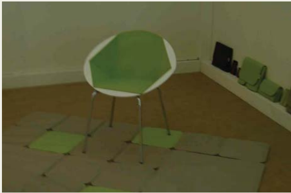
I. Utilización del fieltro en carteras, alfombras y cobertores