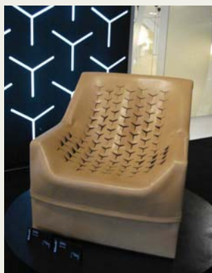
Molteni: Sillón de cuero SKN