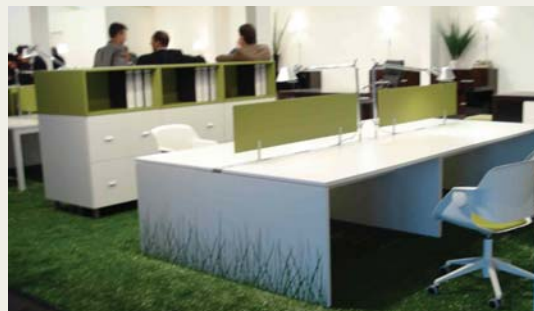
La naturaleza presente en los espacios de trabajo

Las propuestas se dividieron en tres categorías: espacios laborales, productos/objetos de decoración para el trabajo e instalaciones para el entorno laboral. A través de estos ejes se buscó suministrar una herramienta para que las empresas planifiquen su producción y transmitan un mensaje de creatividad al servicio del usuario.