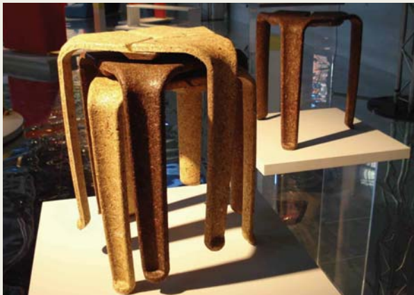
A. VIA: banqueta realizadas con virutas de madera y tanino