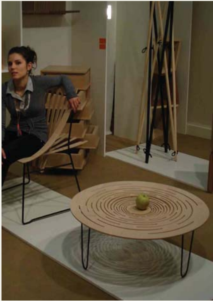
Madera terciada. Mínima utilización de materia prima. El negro, el blanco y las formas puras sobreviven como los grandes clásicos.

La sobriedad, la elegancia y el minimalismo conviven con la extravagancia, el lujo y la sofisticación.