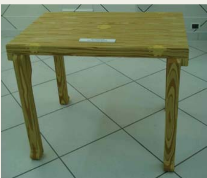
J. Droog: Mesa protegida con una tela (simil madera)

Los materiales que se destacan por sus nuevos usos son el metal, la cerámica y la mayólica, así como los procesos de alta tecnología en las terminaciones (laqueados y cromados).