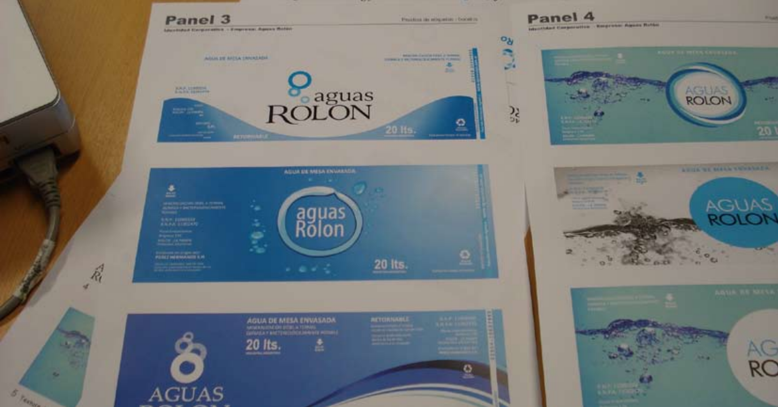
Proceso de diseño de etiquetas de envase de 20 l.