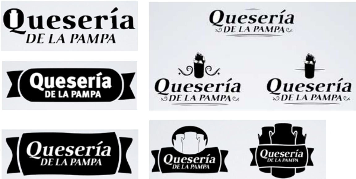
Proceso de diseño del logotipo