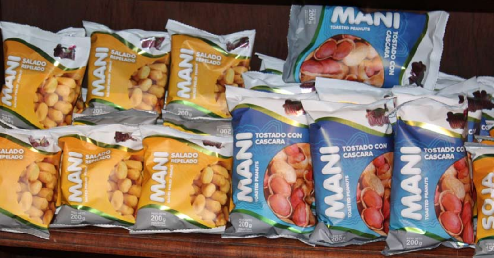
Envases con nuevo diseño presentados en Expopymes 2011.

LUEGO DEL DIAGNÓSTICO SE RECOMENDÓ LO SIGUIENTE: