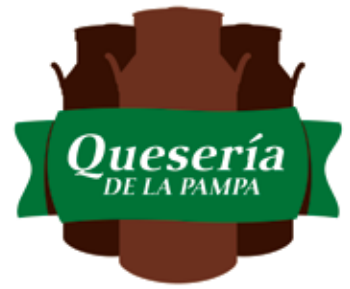
Marca gráfica final