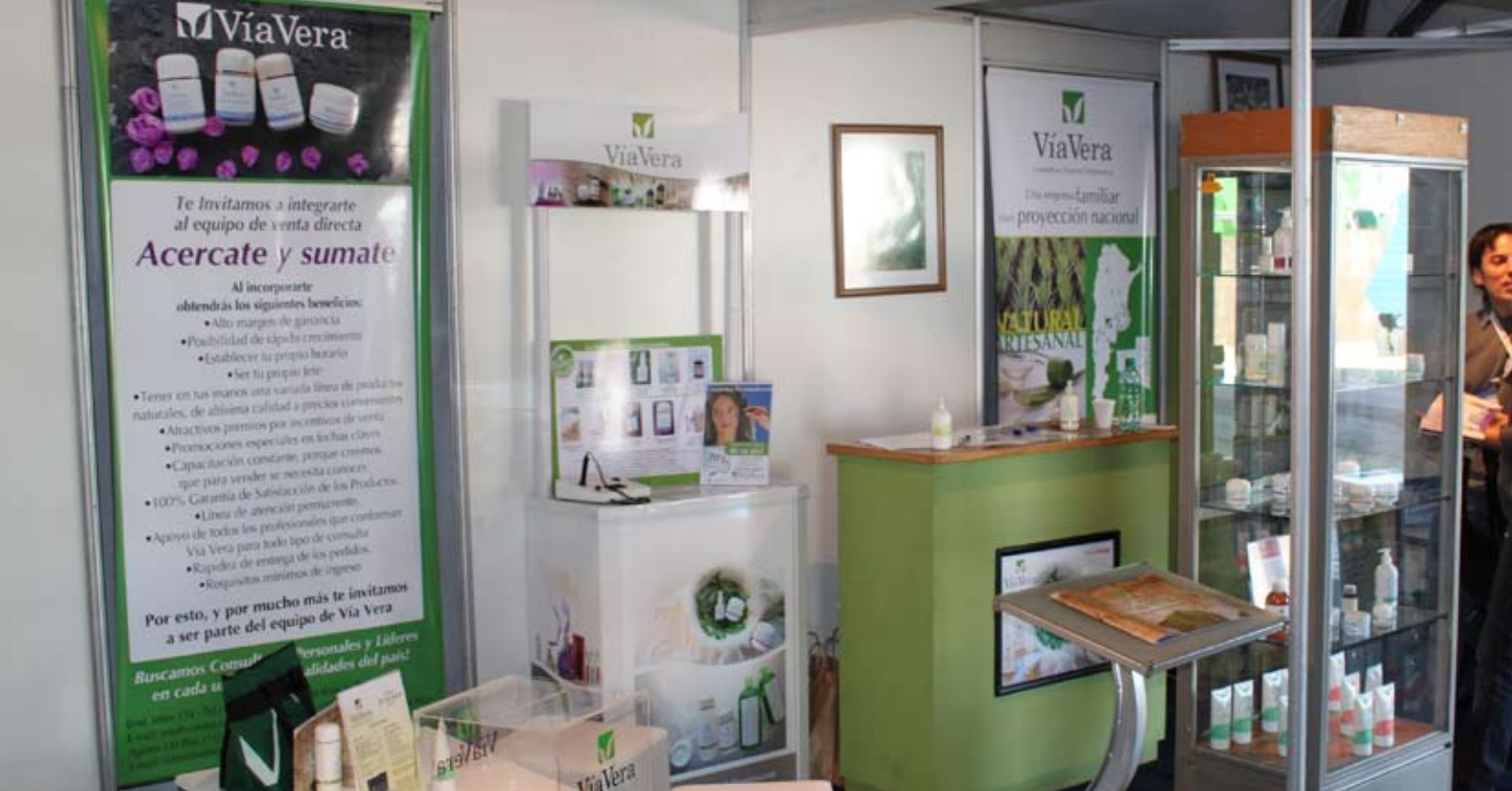
ExpoPymes 2011. Santa Rosa, La Pampa.