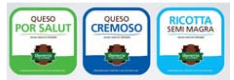
Familia de quesos ya ofrecidos en el mercado. ExpoPymes 2011. Santa Rosa, La Pampa.