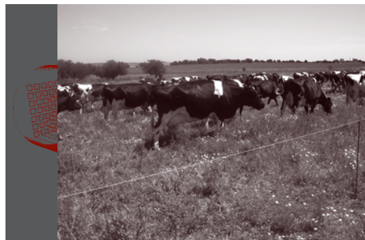
Disposición de espacios abiertos para el bienestar animal.