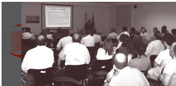
Dictados de cursos de formación

Las gomas y resto tuberías y juntas cuando se aprecie desgaste o pérdida de vacío de la instalación.