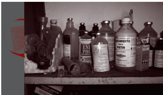
Peligros químicos en el tambo

La presencia de residuos de distintos orígenes en los alimentos es uno de los puntos en los que se está haciendo especial hincapié en los últimos años, dado que la presencia de estas sustancias aunque sea a niveles muy bajos puede tener efectos acumulativos y producir problemas a lo largo del tiempo.