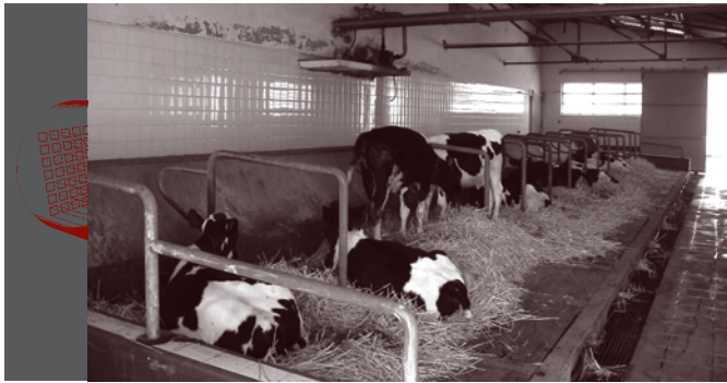
Área de refugio y protección frente a las inclemencias del tiempo.

Al realizar la valoración de este capítulo se debe considerar: