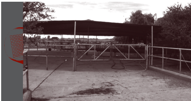
Playa de espera con mediasombra para protección del sol.