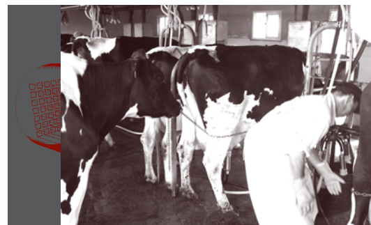
Higiene e indumentaria del tambero en la rutina de ordeño.