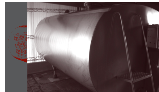
Tanque de enfriamiento de leche