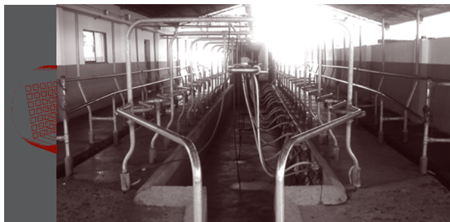
Mantenimiento e Higiene de la sala de ordeño

Se acompañan las fichas técnicas y dosis de los productos de limpieza.