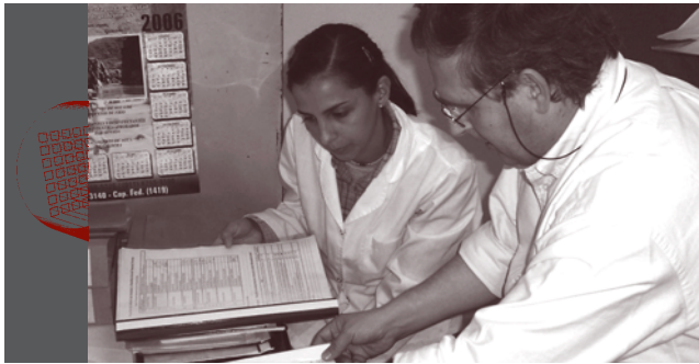
Documentación y registros en el tambo.