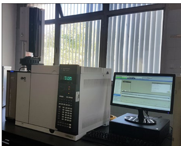
Figura 1: Reformulyzer M4

Incorporación de una nueva tecnología al Laboratorio de Combustibles con el fin de cumplir con los requerimientos del PNCCC que permite cuantificar los diferentes grupos de compuestos químicos que conforman la nafta, dando énfasis al contenido de benceno, aromáticos y bioetanol.