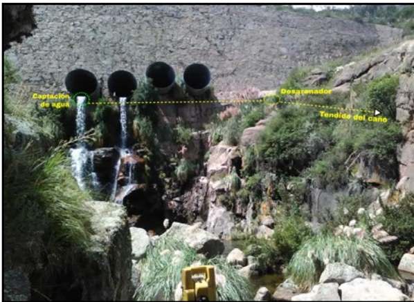
Imagen parcial del relevamiento topográfico y posible localización de los componentes a instalar.

Proveer de energía eléctrica a pequeños emprendimientos y/o familias rurales de la zona de las Altas Cumbres (Pcia. de Córdoba) mediante el aprovechamiento de cursos de agua con la tecnología de micro-turbinas, dejando capacidades regionales instaladas para futuras demandas.