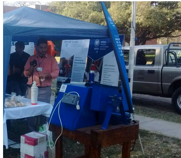
Máquina para determinación de durabilidad mecánica VRB-C01 presentada en la 2da Semana de la Bioenergía en Tucumán.

Aplicación de la norma a un biocombustible desarrollado en la Planta Demostrativa de Pelletizado INTI (Chaco) en conjunto con la Facultad de Ciencias Agrarias de la Universidad Nacional de Rosario, a partir de biomasa no convencionales ( Spartina Argentinensis ) el cual presenta resultados favorables en cuanto a sus propiedades físicas y resistencia para el transporte y logística.