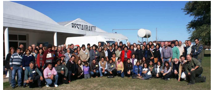
Figura 4: Actores interinstitucionales (trabajo articulado con emprendedores Textiles y referentes de organismos públicos y privados).