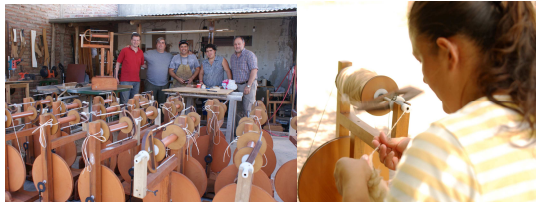
Figura 2: Realización de Ruecas y Trabajo con las mismas..