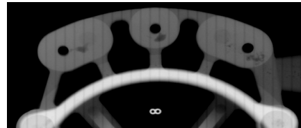
Figura 4: Radiografía Industrial sobre sección de agujeros roscados de pieza modificada

A modo de validar los resultados en planta, se volvió a realizar una radiografía industrial, en este caso digital, sobre una pieza colada con la matriz modificada, donde puede verse la disminución del tamaño de los rechupes y el alejamiento de la superficie a ser roscada.