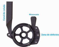
Figura 1: Carcasa fundida, mazarota y canal de colada

En primera instancia se realizó un relevamiento de la pieza, obteniendo el modelo CAD de la misma, en conjunto con su sistema de alimentación y mazarota. Se individualizó la zona crítica donde se evidenciaban de manera superficial los defectos al momento de realizar el roscado.