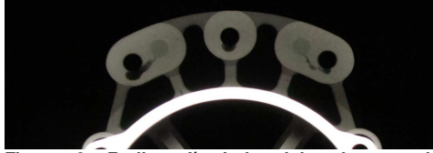
Figura 3: Radiografía Industrial sobre sección de agujeros roscados

Como ya se conoce, la solidificación del aluminio fundido sufre un proceso de contracción, dada la variación de su volumen específico, lo que genera en las piezas defectos por rechupes.