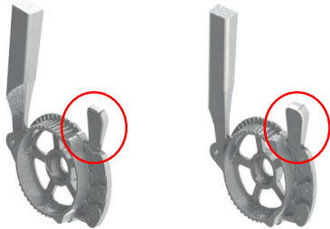
Figura 4: CAD de modificación geométrica propuesta

Con el fin de reducir los rechupes, se buscó retardar el enfriamiento de la mazarota, considerando limitaciones impuestas por el usuario en relación al retrabajo a realizarse sobre la matriz, se propuso la ampliación del espesor de la misma, de 4 a 8mm, haciendola coincidir con el espesor de pieza en dicha zona.