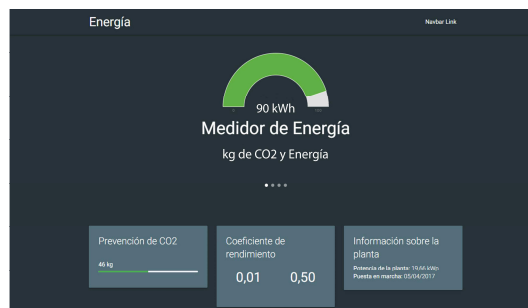
Figura 1: Página web

Como hoy en día resulta muy importante disponer de la información en tiempo real, se desarrolló una página web para poder visualizar los parámetros de interés de todos los módulos bajo estudio. Para llevarlo a cabo, se conectó el dispositivo Master vía Ethernet mediante un módulo que se consigue fácilmente en el mercado: un Arduino Ethernet Shield. De esta forma, se pudo reportar los datos a una base de datos MySQL, desde la cual se extrajo la información para el armado de la página web.