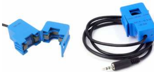
Figura 2: Sensor de corriente utilizado SCT-013-50

Tomando como punto de partida que nuestra medición no fuese invasiva, se eligió para la obtención de la señal de corriente un sensor de la familia SCT-013. Este permite medir la corriente que circula por un conductor sin necesidad de interferir en el mismo, basándose en el principio de inducción electromagnética.