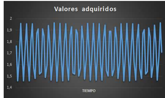
Figura 5: Señal de tensión adquirida a través de la placa adquisidora de corriente

En un primer ensayo se obtuvo la siguiente señal de tensión.