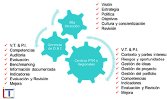
Figura 2: Integración áreas y competencias

La Gerencia de Innovación y Desarrollo del INTI lidera este proceso asumiendo la responsabilidad de promover la cultura de la Innovación.