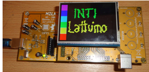
Figura 3: Lattuino en la Kéfir I. Incluyendo un shield de Arduino con pantalla táctil.

Como verificación final se conectó un shield de Arduino que posee una pantalla sensible al tacto. Luego se adaptó uno de los programas demostrativos de dicho shield que permite dibujar en la pantalla táctil. Dicho programa se puede observar en la figura 3, donde se muestra a las placas Milk y Kéfir I interconectadas, junto con el shield mencionado.