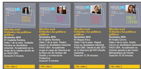
Imagen 1: Mediateca del INTI: http://www.inti.gob.ar/mediateca/seminarios.htm#

En este marco, durante el 2015 y 2016 se produjeron un conjunto de entrevistas pensadas para su circulación a través de internet y que recuperan las experiencias profesionales de diseñadores en dos formatos: gráfico y audiovisual.