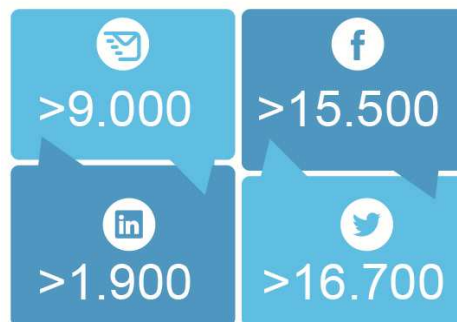
Gráfico 3: base de distribución.

Por otro lado, a partir de la realización de estas piezas pretendimos ofrecer desde el Estado productos comunicacionales que se adapten a las nuevas prácticas de lectura y consumo de la información.