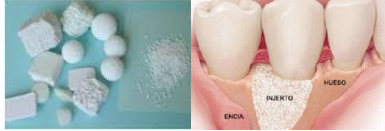
Figura 2: Muestras de implantes dentales y su implementación.

En la Tabla 1 se presentan las fases cristalinas que se pueden encontrar habitualmente en este tipo de materiales. Se indica el número PDF Card que corresponde a esa fase cristalina incluida en las bases de datos reconocidas internacionalmente.