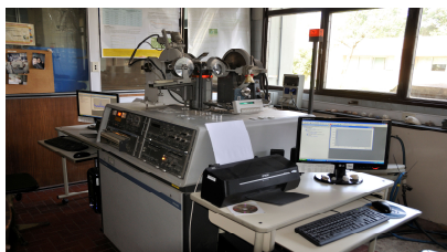
Figura 1: Equipo de Difracción de Rayos X

Se presenta la aplicación del método de Rietveld en el estudio de estos materiales.