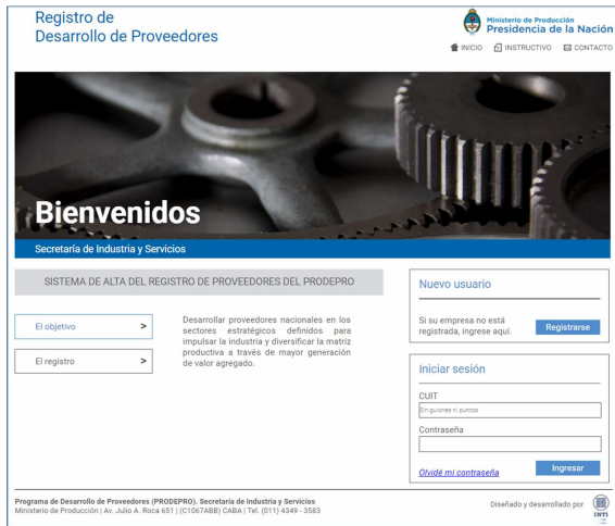
Imagen 1- Home del PRODEPRO - http://www.registroprodepro.gov.ar/

*Desde INTI, trabajaron en conjunto: Trabajo y Educación a Distancia (Tecnología de Gestión) y Apoyo a la Comercialización de la Economía Social (en ese entonces, Gerencia de Asistencia Tecnológica para la Demanda Social).