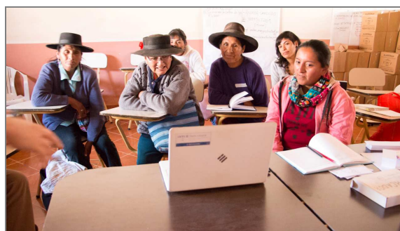
Figura 2: Caso de acción de capacitación en la provincia de Jujuy (2017).

Es el espacio de interacción entre los actores y el material creado en el Centro. Buscamos generar capacidades en los diferentes beneficiarios, que les permitan afrontar los desafíos sin crear lazos de dependencia. La oferta para el territorio comprende una variedad de posibilidades como asistencia técnica para el desarrollo de productos o servicios, dictado de capacitaciones o charlas de sensibilización. Abarcando un amplio abanico de temas relacionados con el diseño en el medio productivo.