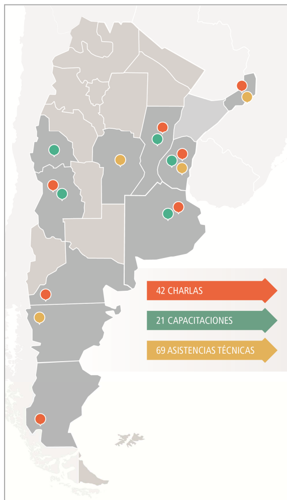
Figura 3: Acciones en territorio INTI-Diseño Industrial, período 2016.

académico, las organizaciones, los Centros INTI, en pos de impulsar y optimizar la gestión del diseño en el seno de las empresas argentinas. Entendemos que integrar un espacio de participación multidisciplinario nos permite aprender, como así también identificar y transmitir la complejidad, la riqueza y la profundidad del diseño como una herramienta de optimización. De esta manera, se fortalecen las capacidades locales con la finalidad de atender directamente la demanda en los focos productivos.