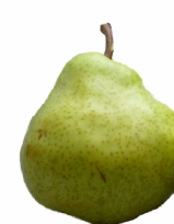
Figura 1: Variedades comerciales de manzanas y peras del Alto Valle de Río Negro y Neuquén.