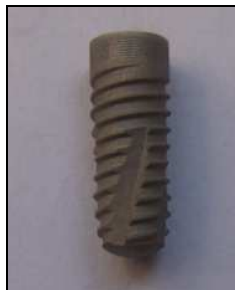
Figura 2: imagen de una de las muestras evaluadas.

Se evaluó la presencia de posibles contaminantes en implantes dentales fabricados por una empresa del medio local. En la Figura 2 se presenta una imagen del producto evaluado.