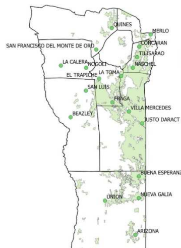
Figura 2: Áreas cultivables de la provincia de San Luis.

El área agrícola en la provincia de San Luis se encuentra ubicada hacia el este, en la franja con mayores precipitaciones de la provincia (Figura 2). De esta superficie, en 2015, 152.250 ha fueron implantadas con maíz. Se observa que los criaderos de mayor escala y el área cultivada se solapan, facilitando el aprovechamiento de ambos recursos, reduciendo principalmente los costos de flete.