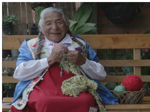
Figura 6: emprendedora colombiana tejiendo con seda productos artesanales.

3. Mejorar el acceso a insumos críticos para la producción sericícola. Se buscará alcanzar la autosuficiencia regional en la provisión de huevos de gusano de seda de calidad a partir de la capacitación de personal técnico en el Instituto Bicológico di Padova, el mejor centro de investigación y mejoramiento occidental; el fortalecimiento de los centros de mejoramiento y multiplicación de huevos en Argentina, Brasil y Cuba; y la distribución gratuita de dichos huevos. El objetivo cuantitativo es lograr 200 telainos/año desde Argentina y establecer las bases de mejoramiento para los otros dos centros, de manera que a mediano plazo puedan producir híbridos propios. Los huevos producidos se enviarán a cada centro demostrativo, quienes los almacenarán en frío y podrán activarlos a medida que sea necesario. En tal sentido, será ampliado el Laboratorio de sericultura de la Facultad de Agronomía, Universidad Nacional de Buenos Aires, que viene trabajando en el mejoramiento y multiplicación de gusanos de seda y que actualmente distribuye huevos y larvas sin fines de lucro, pero con capacidad limitada debido a su estructura edilicia.