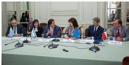
Figura 2: firma de contrato de co-financiación. En el centro de la foto los firmantes: el presidente del INTI

El trabajo presentado por el INTI “ Contribución a la reducción de la pobreza en la región de América Latina y El Caribe (ALC) con enfoque sustentable y agregado de valor local ”, es uno de los nueve proyectos seleccionados de 84 propuestas presentadas, y el único de Argentina (ver Figura 2).