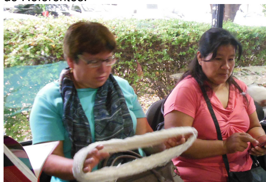
Figura 7: artesanas de la seda de Colombia y Argentina. Encuentro en INTI-Textiles, marzo 2017.

4. Fortalecer la comunicación y cooperación horizontal Sur-Sur. A partir de un sistema de funcionamiento en Red integrado por referentes nacionales de cada país co-solicitante y asociado se estrecharán vínculos de cooperación horizontal en reuniones de Comité de Referentes.