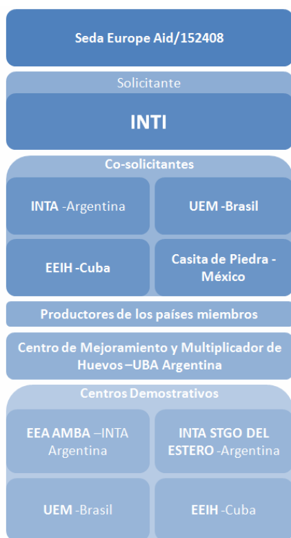
Figura 2: actores participantes del proyecto Seda.

Como instituciones co-solicitantes participan: el Instituto Nacional de Tecnología Agropecuaria (INTA) de Argentina que trabaja en la asistencia técnica en sericultura en la agricultura familiar; el Laboratorio de Biotecnología de la Universidad Estadual de Maringá (UEM) de Brasil, con experiencia en biotecnología con investigaciones en biología molecular en gusanos de seda y en producción de capullos coloreados o con propiedades antimicrobianas; la Estación de Experimentación Agropecuaria Indio Hatuey (EEIH) de Cuba, que realiza investigación y extensión de sericultura apoyando a talleres protegidos de discapacidad en la producción de seda; y el Patronato del Centro Turístico y de Capacitación Sericícola y de Rebojería de Jiquilpan, Michoacán (conocido como Casita de Piedra ), de México, que tiene un área de apoyo para las pequeñas sericultoras y artesanas campesinas-indígenas de la región. También forman parte del proyecto en calidad de asociados, la Facultad de Ingeniería Textil de la Universidad Pontificia de Medellín (UPB) de Colombia que brinda apoyo a cooperativas de mujeres artesanas y productoras de la seda en la región de Cauca (Figuras 4 y 5) y la Cooperativa Social ( SocioLario ) de Italia, que tienen una amplia trayectoria en la sericultura con enfoque de desarrollo de población vulnerable y promoción social.