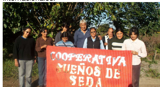
Figura 4: integrantes de la cooperativa sericícola argentina de Jujuy, Sueños de Seda.

También se efectuarán dos workshops internacionales.