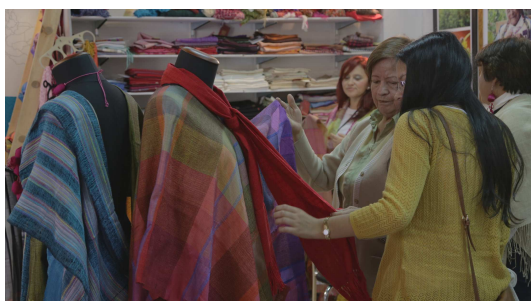
Figura 5: textiles realizados con seda por mujeres artesanas de la región de Cauca en la cooperativa CORSEDA.

2. Generar conocimientos de aplicación práctica directa , que pueden mejorar el agregado de valor y el manejo sustentable de la sericultura. Algunos de problemas actuales versan sobre nuevas técnicas o formas de agregado de valor, como el desarrollo de capullos de seda coloreados o con propiedades antimicrobianas. Para ello, se plantea el apoyo a acciones y actividades específicas para cubrir nichos técnicos en el manejo sustentable o que propongan usos alternativos de la sericultura, ofreciendo mayor captura de riqueza por parte de los beneficiarios finales. Se plantea la capacitación de un grupo de personas de la región en el uso de la seda y subproductos como la sericina y fibroína con usos medicinales.