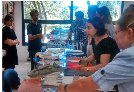
Figura 1: una comitiva enviada por la Unión Europea visita al Centro INTI-Textiles para conocer sobre el Proyecto. Marzo 2017.