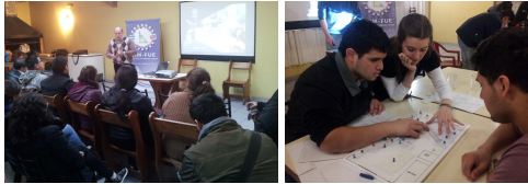
Figura 2: Talleres de capacitación

2) Talleres de Capacitación: en base a los puntos a mejorar detectados durante los diagnósticos, se seleccionaron 5 temas de mejora, comunes a las 3 empresas: 7 pérdidas , Programa 5S , Calidad , Planificación de la Producción y Layout . Se desarrollaron talleres teórico-prácticos en donde se capacitó al personal de las 3 (tres) empresas.