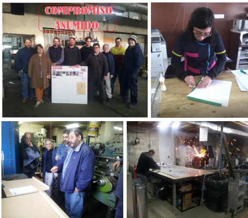
Figura 3: Implementación

Los temas de mejora desarrollados en las empresas fueron: Programa 5S, Programación y Control de la Producción, Calidad, Gestión de Stock y Layout.