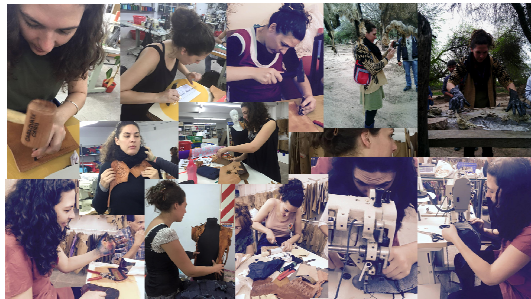
Figura 9: asistencia técnica personalizada – desarrollo de productos de cuero .