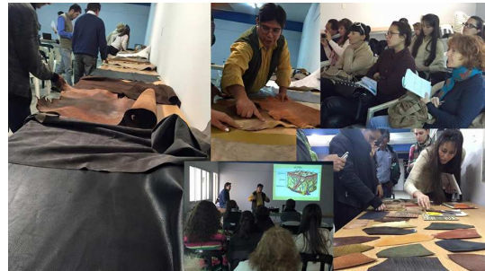
Figura 1: capacitaciones teóricas

La metodología se basa en una incubadora de empresas, centrada en cinco actividades principales: 1) Seis capacitaciones teóricas abiertas a toda la comunidad de los rubros involucrados, 2) Coaching y capacitaciones prácticas personalizadas a las 12 empresas seleccionadas, sobre cada uno de los temas tratados en las capacitaciones teóricas, 3) Experiencias guiadas en el territorio provincial, explorando vivencialmente los distintos eslabones de la cadena de valor del cuero, con sus actores y contextos reales, Esta actividad se realizó con las empresas seleccionadas, 4) Coaching y asistencia técnica a las empresas seleccionadas, en la tarea de incorporar el cuero nativo a sus propuestas de productos de diseño de temporada, 5) Asistencia técnica en comunicación de marca (fotografía y catálogo) de los productos resultantes de este proyecto, de las empresas seleccionadas