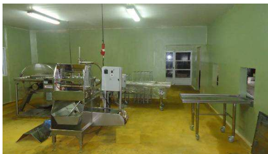
Figura 2: Sala de Extracción de Miel, Coop. Apícola Diamante (posterior a la asistencia de INTI).