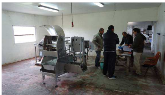
Figura 1: Sala de Extracción de Miel, Coop. Apícola Diamante (previa a la asistencia de INTI).

Con base en los resultados se establecen las Propuestas de mejoras las cuales son los aspectos a trabajar y los objetivos a alcanzar y se proponen planes de trabajo específicos, que incluyen las diferentes instancias en que el INTI tendrá intervención a través de talleres de capacitación y nivelación de conocimientos referidos a las normativas de referencia, asesoramientos en la optimización de procesos y adecuación edilicia de los establecimientos.