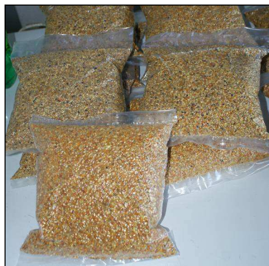
Figura 4: Presentación de polen envasado al vacío.

Respecto a la producción de Polen, como primera instancia se consensó junto al Municipio de Ibicuy y la Cooperativa un nuevo emplazamiento del establecimiento y se realizó el diseño del nuevo establecimiento además de un informe de mejora del proceso y el producto. De aquí ha surgido un proyecto de I+D+i para la investigación de las condiciones óptimas de procesado de polen para que este sea apto y de calidad diferencial.