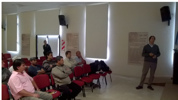
Figura 3: Capacitación sobre Introducción al Proceso de Biodigestión - Operación y Seguridad en Plantas de Biogás.

El sistema propuesto va a generar 15 m 3 Biogás/d, con una carga de 500 a 800 kg/d de FORSU. Como producto de la actividad se va a generar 796 kWh/mes de energía eléctrica y 252 m 3 biogás/mes, la generación de biol se