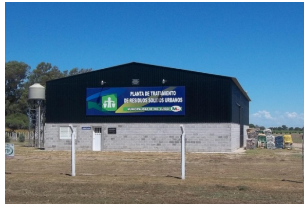
Figura 1: vista de la planta de recuperación de RSU.

también recursos para algunas etapas del proyecto. El diseño de la planta demostrativa de biodigestión, fue realizado por INTI San Luis e INTI La Pampa, incluyendo la dirección técnica. La mencionada iniciativa contempla la instalación de una unidad de biodigestión anaeróbica con generación de biogás, la conversión energética para el uso en la planta de clasificación y la valorización de los subproductos líquidos. Con este proyecto, se busca transformar a la planta de clasificación, recuperación y disposición final de RSU en un modelo de gestión de los residuos.