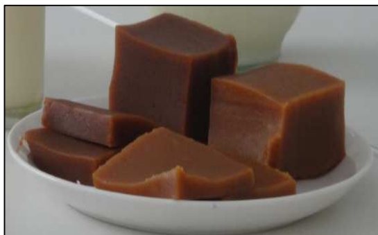
Figura 2: Foto del bocadito.

La figura 2 muestra el producto terminado.