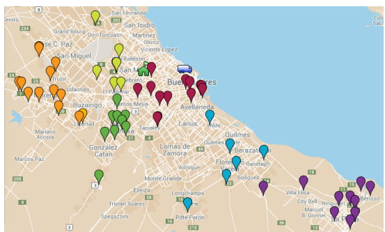
Figura 4: Talleres CABA, GBA, La Plata y alrededores agrupados por color según zona asignada

Sistema de similares características para la fabricación de guardapolvos escolares para la Gobernación de Formosa en talleres distribuidos por el interior de la provincia.