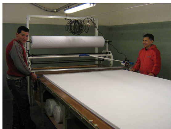
Figura 5: Corte de guardapolvos en el CDI de Barracas