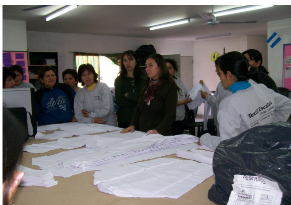
Figura 3: Capacitación en fabricación de guardapolvos escolares en la localidad Los Ralos, Pcia. de Tucumán.

En CABA y la Provincia de Buenos Aires son en la actualidad 62 talleres, incluyendo localidades del interior como Mar del Plata, San Nicolás, Coronel Suárez y Los Toldos.