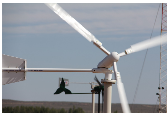
Figura 1: Equipos bajo ensayo

Durante el año 2013 se recopiló los datos necesarios para la confección de las curvas de potencia. A lo largo del proceso de medición se confeccionaron informes de observación de funcionamiento, mediante los que se pudo dar una retroalimentación a los fabricantes respecto al desempeño de los equipos. Estos han sido de utilidad para el rediseño de algunos detalles de los mismos.