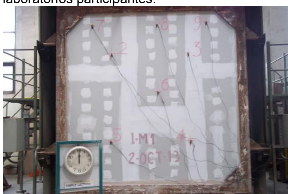
Fotografía 1: Aspecto de la muestra durante uno de los ensayos realizados en el Laboratorio de INTI.

El elemento constructivo seleccionado para la realización del interlaboratorio fue un panel liviano, de placa de yeso. A los efectos de garantizar un tiempo mínimo de ensayo que minimice las distorsiones generadas en los primeros minutos del ensayo se seleccionó un sistema de doble placa a cada lado de la estructura metálica interior clásica utilizada por estos sistemas (parantes y soleras de acero galvanizado). El material para confeccionar los paneles correspondientes fue suministrado por la empresa Knauf, extraído de un mismo lote de producción, de su planta de la ciudad de Mendoza. Desde allí fue trasladado a los 3 laboratorios participantes.