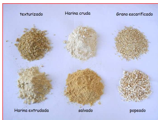
Figura 2: Distintos productos desarrollados a partir de quinoa

La empresa Pachamama Products se dedica esencialmente a agronegocios, produciendo, procesando y comercializando semillas comestibles y sus derivados. Desde hace 6 años se comenzó a trabajar con la misma con el objeto de generar valor agregado a la quinoa, desarrollando nuevos productos, brindando más alternativas a los clientes de la empresa y promoviendo el agregado de valor a toda la cadena de comercialización.