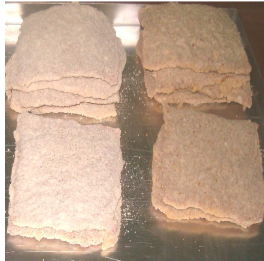
Figura 3: Pruebas con rebozadores a base de harina de arveja.

Una vez obtenido el rebozador, se llevó a cabo la evaluación de calidad funcional y sensorial mediante un grupo de consumidores reclutados al azar. Se prepararon y cocinaron milanesas de carne vacuna para evaluar las características del mismo ( figura 3 ). Las mismas mostraron un comportamiento satisfactorio para los parámetros funcionales y sensoriales evaluados (aparición, aroma, sabor, pick-up, color, crocancia y adherencia).