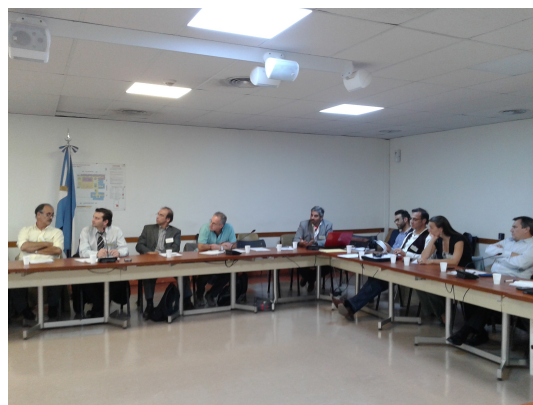
Figura 1: Encuentro Nacional de Energías Renovables realizado en el Congreso de la Nación Argentina.

Fundación Directorio Legislativo; Energía Provincial Sociedad del Estado de San Juan; Agencia de Protección Ambiental de la Ciudad de Buenos Aires; Ministerio de Planificación y Ambiente del Chaco; Universidad Nacional del Centro de Bs As; Fundación Avina; Subsecretaría de Energía del Chaco; Dirección de Energía de Mendoza; Cámara Argentina de Energías Renovables; Universidad Tecnológica Nacional – Facultad Regional Rosario; Univ. Nacional de Santiago del Estero; Y-TEC; Sec. De Energía de Corrientes; C.F.E.E; Secretaría de Energía de la Nación; Sec. De Desarrollo de Ciencia y Técnica de Santiago del Estero; Inst. Energía de Santa Cruz; Programa Energía Eléctrica – Secretaría de Energía de Salta; CNEA – IRESUD; Secretaria de Energía de Córdoba; Consejo de Energías Renovables de Misiones; CEARE.