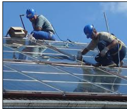
Figura 1: instalación de sistema solar térmico.

Con esta actividad se espera reducir la ocurrencia de fallas en instalaciones de SST, teniendo en cuenta que estudios hechos a escala a nivel internacional, indican que los problemas encontrados, generalmente son producidos por errores en la elaboración del proyecto técnico y/o en su ejecución.